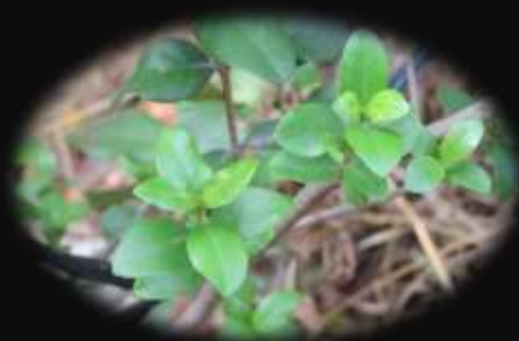
Hojas de Pitra.

Después de hora y media de recorrido, por el pantano me encuentro con un sendero que sigo hasta llegar al camino ripiado principal y allí me llevo la sorpresa ya que en la entrada hay un letrero, que grafica de alguna manera esta experiencia y reza “El Bosque Encantado” .