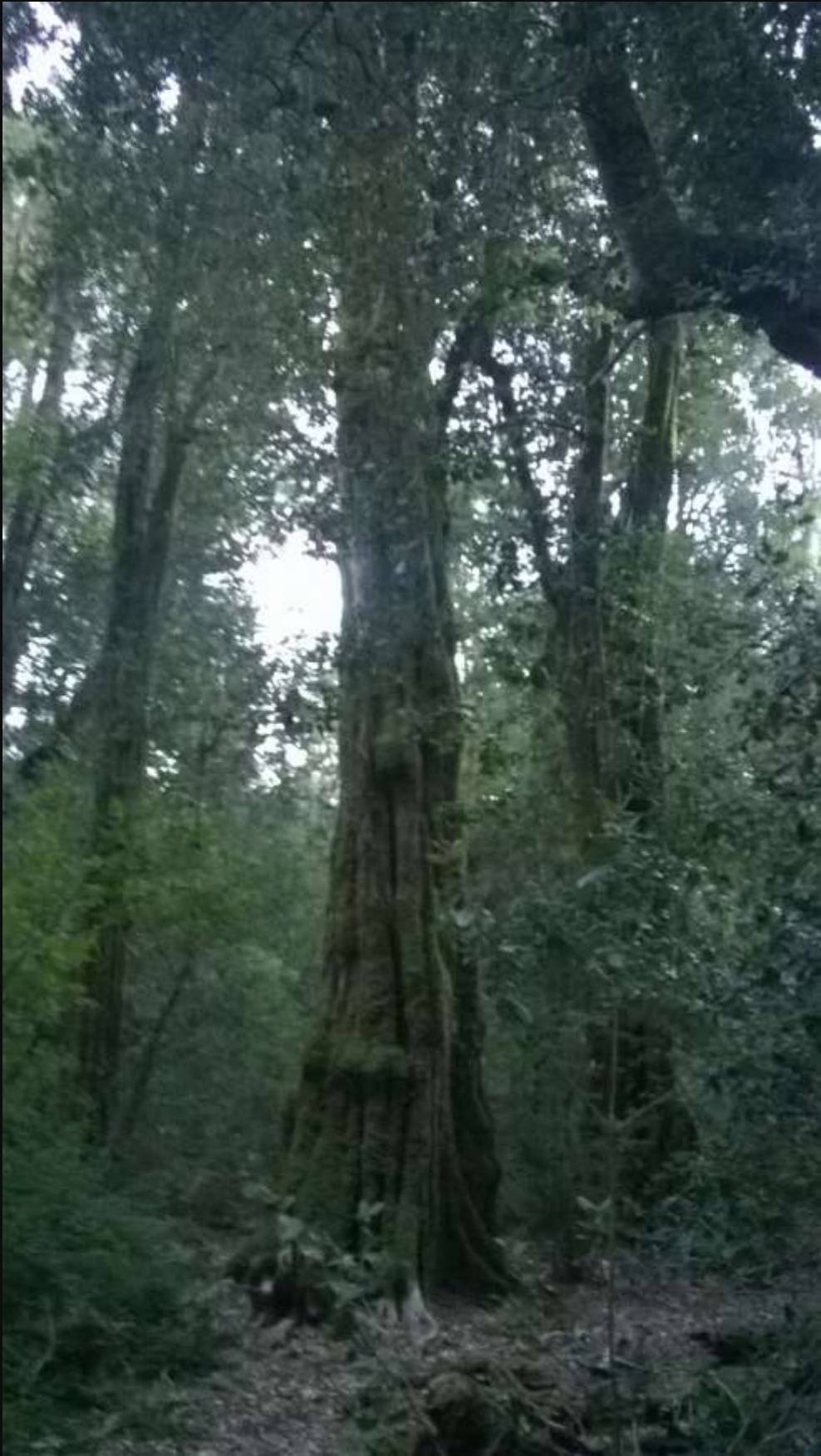
Gran Pitra, llena de musgos al amanecer.