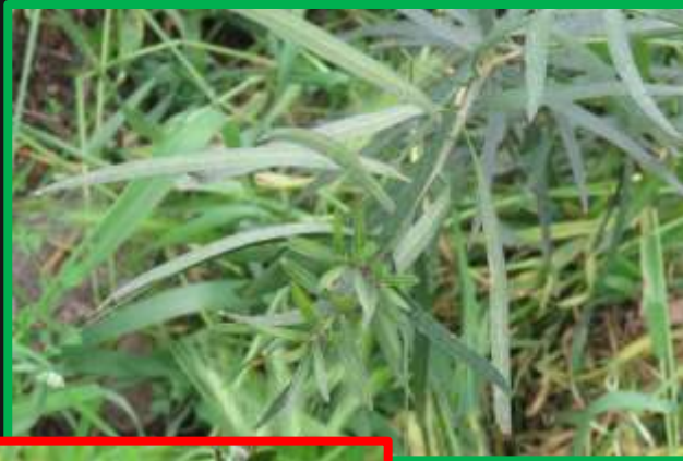
Mañío hoja larga